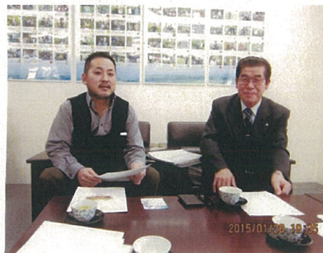
(原品質管理部長と)

化学肥料や農薬の多投によって支えられた戦後の日本農業は、多方面で行き詰まりを見せている。農業者有志は土壌微生物の生態や働きを知り、当時の農業に危機感を持ち、同志を集めて生産販売集団をつくったとの事である。一貫して土作りと味にこだわり、有機農業を一つの目標として、持続可能な農業の再構築に実践を通してきた取組に深く感動した。TPP締結後の日本農業のビジネスモデルになると思われる。