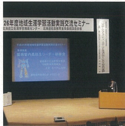
事例発表 1 について