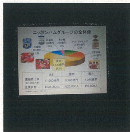
日本ハム全体の全体像