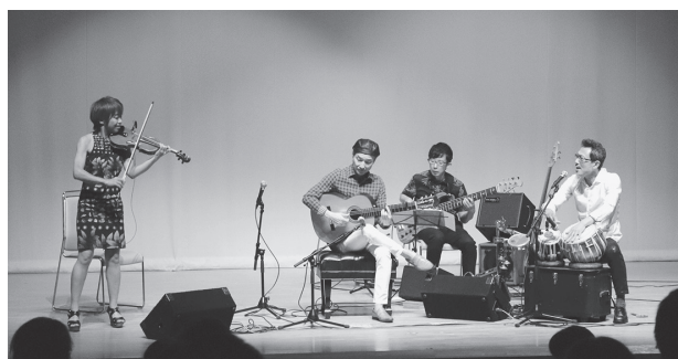
異国情緒あふれる演奏に酔いしれます