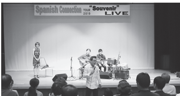
音楽だけではなく、トークでも盛り上げます