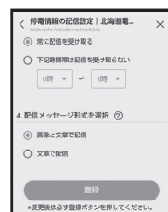
④ 受け取る時間帯と配信メッセージ形式を選択したら登録完了!