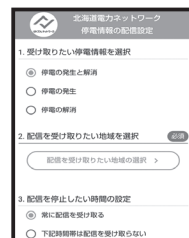
② 受け取りたい情報を選択したら、受け取りたい地域を選択