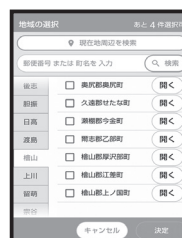
③ 停電情報を受け取りたい地域を最大4か所まで選択