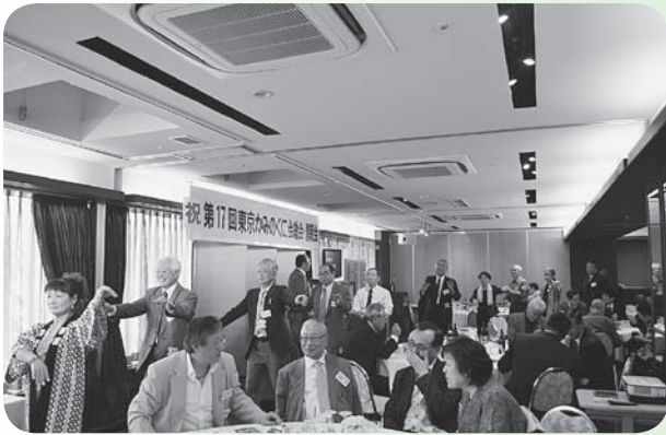
東京かみのくに会

また、東京かみのくに会でも昔の思い出が話し合われたほか、図書購入費用として10万円の寄贈が決定され、懇親会では上ノ国の風景などを映したスライド上映や皆で踊る恒例の上ノ国音頭が行われるなど、どちらも故郷への想いが伝わってくる温かい雰囲気でした。 また、それぞれの会場では、本町特産品の物品販売も行われ、「赤カブ」や「かたこもち」など、幼いころに食べた懐かしい味を求める方々で賑わっていました。