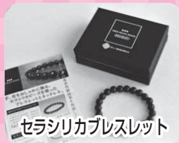
セラシリカプレスレット