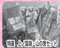
特選 上ノ国海・山の恵セット