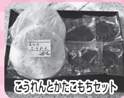
とろれんとかたもちセット