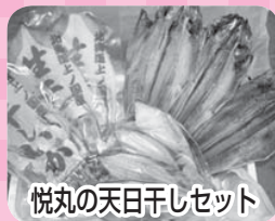
悦丸の天日干しセット