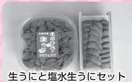
生うにと塩水生うにセット