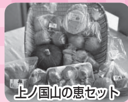
上ノ国山の恵セット