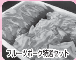
フルーツポーク特選セット