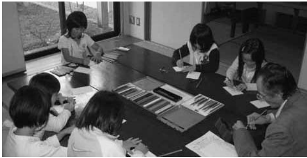
よってけクラブのようす

教育委員会では、「放課後子どもプラン」事業の一環として、放課後の子どもの様々な体験をする「よってけクラブ」を実施しています。クラブでは、缶けりや鬼ごっこ、おはじきやビー玉遊びなどのほか、旧笹浪家住宅などの文化財の施設を見学したり、山・海方面の探険、勾玉づくりの体験学習も行う予定です。内容については教育委員会までお問い合わせください。