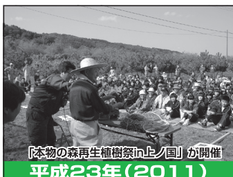
『本物の森再生植樹祭に上ノ国』が開催 平成23年(2011)