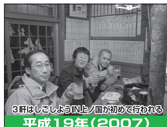
3軒はししょうIN上ノ国が初めて行われる 平成19年(2007)