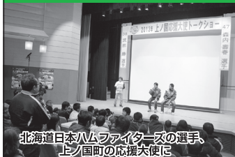
北海道日本ハムファイターズの選手、上ノ国町の応援大使に