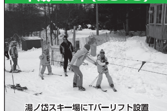
湯ノ岱スキー場にTバーリフト設置