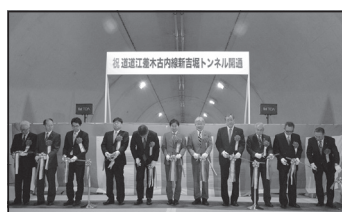
新吉堀トンネルが完成 平成28年(2016)