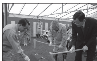
天の川きららトンネル着工 平成20年(2008)