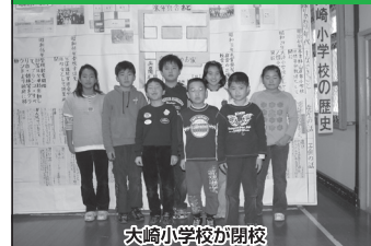
大崎小学校が閉校