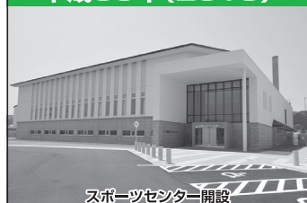
スポーツセンター開設