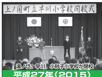
湯ノ岱、早川、小砂子小学校が閉校 平成27年(2015)

平成31年4月30日を最後に「平成」の時代が終わります。 であったか、ここで振り返ってみたいと思います。