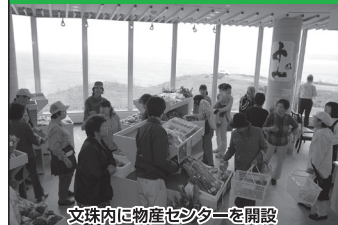
文珠内に物産センターを開設