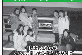
新小安在橋完成 滝沢小児童による橋銘板取り付け