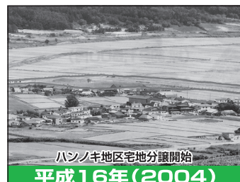
ハンノキ地区宅地分譲開始 平成16年(2004)