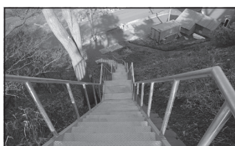
上ノ国地区に避難階段設置 平成24年(2012)