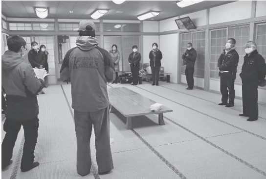
消防職員より訓練内容の指導を受ける

スポーツセンタートレーニング室の利用は、新型コロナウイルス感染症対策のため、予約制となっております。教育委員会では、皆さんが快適に、ご利用いただくため、次のとおり改めてご理解とご協力をお願いいたします。