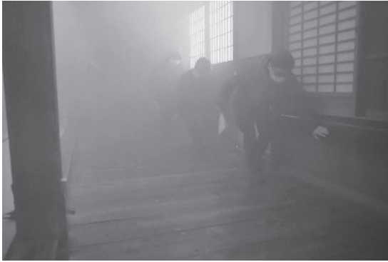
煙の中、壁づたいに避難する様子

最後に、消防職員より訓練の総括と教育委員会より文化財を守るためには地域の皆さんの力が必要であり、そのために文化財を身近に感じ、愛着をもってもらう取組を今後も行うことの説明がされました。