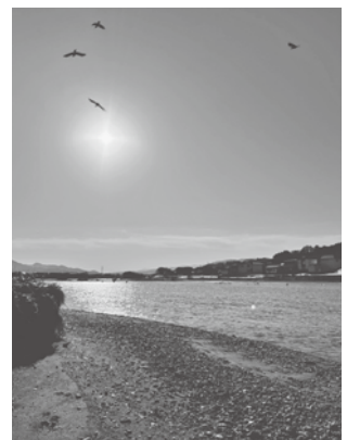
↑散歩中に天の川河口からみた朝日

これから皆様と対話しながら活動する中で、さらなる魅力を見つけていけることを楽しみにしています。