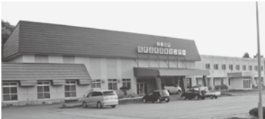
上ノ国町国民温泉保養センター