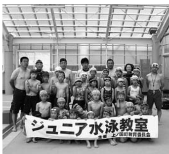
修了証書ももらったヨ

今年も、檜山水泳連盟より2名、町内の先生方8名が指導にあたりました。開会にあたり「水の事故から身を守るため、水泳の基本をしっかりとし身に付けて欲しい」とのあいさつのあと初心者と上級者のグループに分かれて指導を受けました。四日間、参加した児童は、「先生と一緒に練習できてとても楽しかった」と感想を話してくれました。開催期間中、曇り空で室内の温度も上がらず、震え