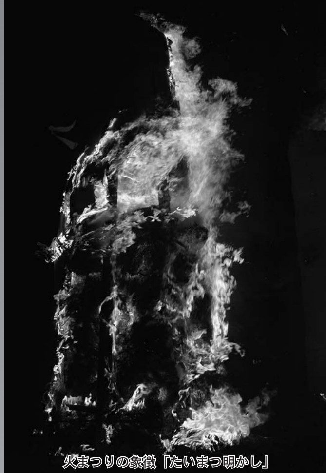
火まつりの象徴「たいまつ明かし」