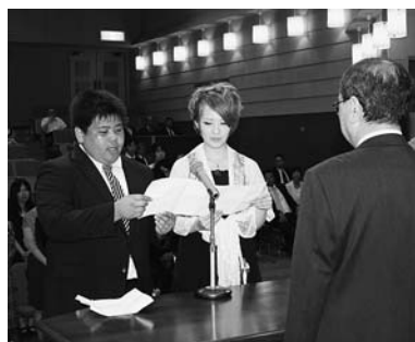
少し緊張気味のお二人

く、面白かった」とスクリーンを見て感想を述べていました。 祝賀交流会は終始和やかなうちに終了しました。