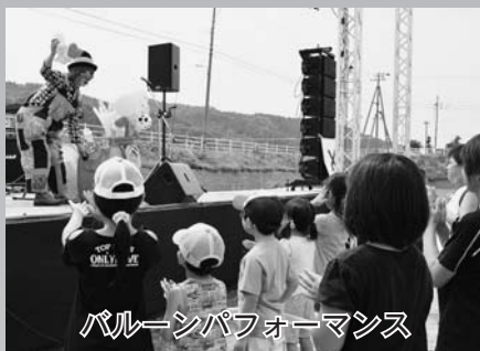
バルーンパフォーマンス