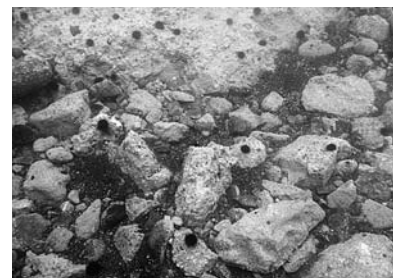
餌（コンブ等）が無い場所に 生息するウニ