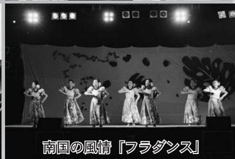
南国の風情「フラダンス」