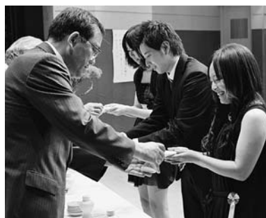
町長から献杯を受ける新成人