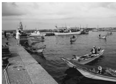
ウニ移植放流作業の様子 （汐吹漁港）