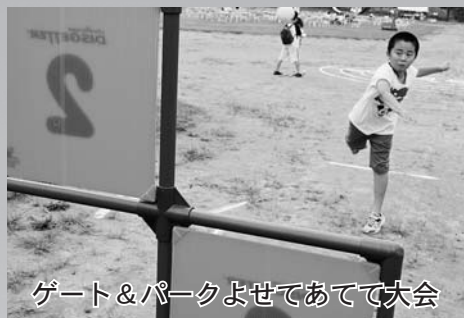
ゲート&パークよせてあてて大会