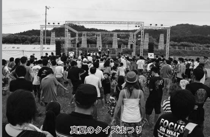
真夏のクイズまつり