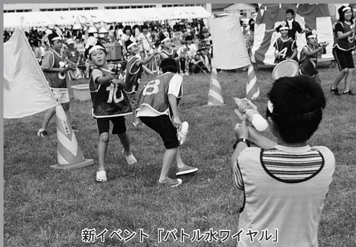
新イベント「バトル水ワイヤル」