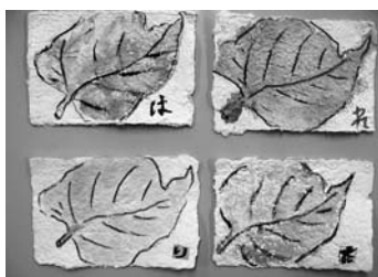
上手に描けました

参加した13人の作品は、教育委員会の壁に展示してありますので、機会があればご覧になって下さい。