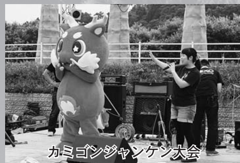
カミゴンジャンケン大会

そして、太鼓演奏と共に高さ約5mの8本の巨大たいまつが真っ赤に燃え盛り、最後の「天の川ドラゴンファンタジー」では約800発の花火が夜空を彩ると、火まつりは最高潮を迎え幕を閉じました。