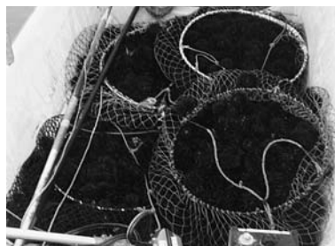
身入りが悪い移植用のウニ