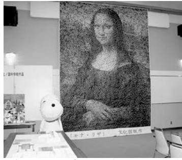
高さ5メートルを超える大作モ

作品展示会では、町内小中学校や個人、団体からモザイク画や書道、手芸品、工芸品など715点が展示され、3日間で約500人が訪れました。