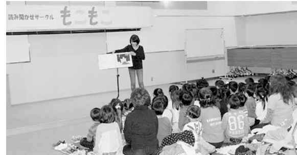
もこもこの皆さんによるえほんの読み聞かせ

開催にあたり上ノ国町絵本サークル「もこもこ」の皆さんが、事前に読み聞かせするえほんの選定や新しいエプロンシアターに取り