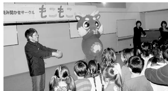
カミゴンの登場に子どもたちは大喜び

また、特別ゲストとして「カミゴン」が登場すると子どもたちは大喜びでカミゴンを囲み、一緒に童謡を歌ったり、踊ったりするなど大いに盛り上がりました。