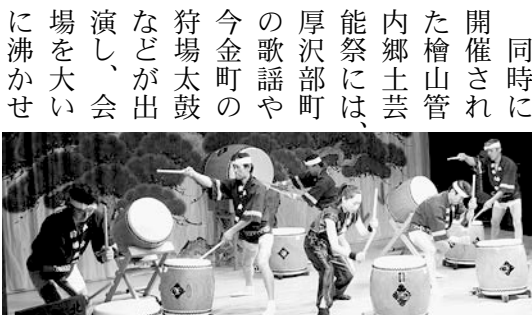
狩場太鼓（今金町）の迫力ある演奏

同時に開催された檜山管内郷土芸能祭には、厚沢部町の歌謡や今金町の狩場太鼓などが出演し、会場を大いに沸かせました。 また、ロビーでは天の川子ども茶道教室による野点も行われ、訪れた人は、子どもたちのおもてなしを堪能していました。