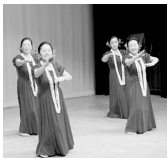
華麗なフラダンスで魅了

上ノ国中学校吹奏楽部の演奏で始まり、滝沢小学校児童による太鼓演奏や華麗なフラダンスなどが披露されました。